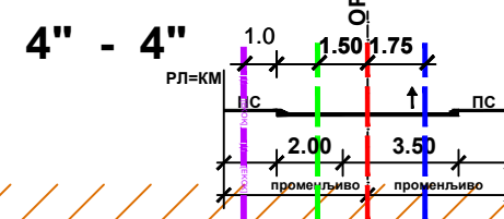
ПС - пешачки саобраћај (тротоар) РТ - разделна трака П - паркирање (паркинг просто ЗП - зелена површина Б - банкина (оивичена)

- Postojeća vodovodna linija koja se unika - Postojeća fekalna kanalizacija koja se unika - Postojeća linija kanalizacija koja se unika - Postojeća vodovodna linija - Postojeća fekalna kanalizacija - Postojeća fekalna kanalizacija - Postojeća linija kanalizacija - Planirana linija kanalizacija - Planirani elektroenergetski kabl 110kV - Postojeći elektroenergetski kabl 35kV - Planirani elektroenergetski kabl 10kV - Planirani elektroenergetski kabl 10kV - Planirani telekomunikacioni kabl - Planirani telekomunikacioni kabl - Postojeća gasovodna distributivna mreža pritiska do 4 bar - Planirana gasovodna distributivna mreža pritiska do 4 bar - Postojeći distributivni gasovod od čeličnih cevi pritiska do 16 bar - Postojeći toplovod